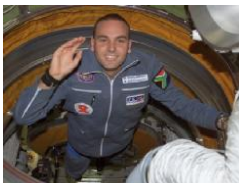
图 1 Ubuntu 创立者 Mark Shuttleworth

Linux 系统基于 1983 年 Richard Stallman 建立的 GUN 计划, 以 1991 年 Linus Torvalds 成功编写出 Linux 内核并于 1994 年发布作为诞生的标志。GNU 是一个大型的软件工程, 在它引领下产生了一大批开放源代码的自由软件。作为一个开源的类 Unix 系统, 用户选择 Linux 自然是基于它的某项独有的优点, 如高安全性、高度网络支持、研究工作的需要、免费等。而 Ubuntu 是目前全世界用户公认的最亲切易用、最受欢迎的 Linux。自 2004 年 10 月发行第一版 Warty Warthog(4.10)后, 至今已陆续发布了 Hoary Hedgehog(5.04)、Breezy Badger(5.10)、Dapper Drake(6.06)、Edgy Eft(6.10)、Feisty Fawn(7.04)、Gutsy Gibbon(7.10)。2008 年 4 月将推出 Hardy Heron(8.04)。 [1]