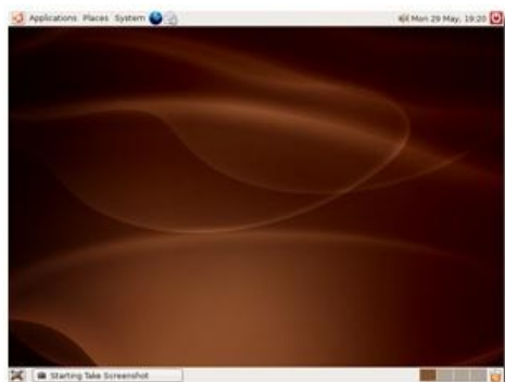
图 2 Ubuntu 7.10 默认桌面(Gnome)

(2) 仅两个分区往往不适合使用。为了保证个人信息安全，推荐将“/home”目录单独挂载在一个分区上。为了保证 Grub 的引导信息的安全，将“/boot”单独挂载也是明智的。其余目录用户可以根据需要选择是否独立为之分配分区。一般“/boot”分区 100M 大小即可，“/home”的大小自行考虑，但应给“/”根分区以至少 5G 空间才能保证够用，一般 7~8G 即可满足需要。“/”与“/home”的文件系统推荐使用 xfs，综合效率为最高。或者 reiserFS，处理小文件时效率极高。ext3 问世时间较早，不太适应现在的使用需要，并且容易出错，速度也慢。